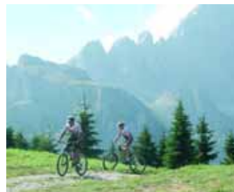
Pag 96. View of Cortina, Monte Pomagagnon / Veduta di Cortina, monte Pomagagnon